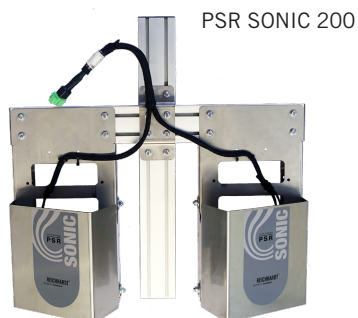
PSR SONIC 200

Ils permettent aussi un excellent guidage pour les applications viticoles et arboricoles. Comme les outils de travail peuvent être amenés très près de la végétation, le guidage par capteurs à ultrason trouve également un grand intérêt dans l'agriculture biologique. Grâce à leurs déflecteurs, les nouveaux capteurs marquent des points avec une meilleure détection des cultures.